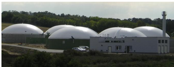
Ausgeführte Anlage in Ziersdorf

Den Stand der Technik und die "Benchmark" moderner landwirtschaftlicher Biogasanlagen stellen die Biogasanlagen der Biopower GmbH an den Standorten Retz und Ziersdorf dar.